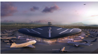
Rue Larampla , Joël Parc

Vol aller et check in à l'hotel ,puis journée libre pour découvrir la ville